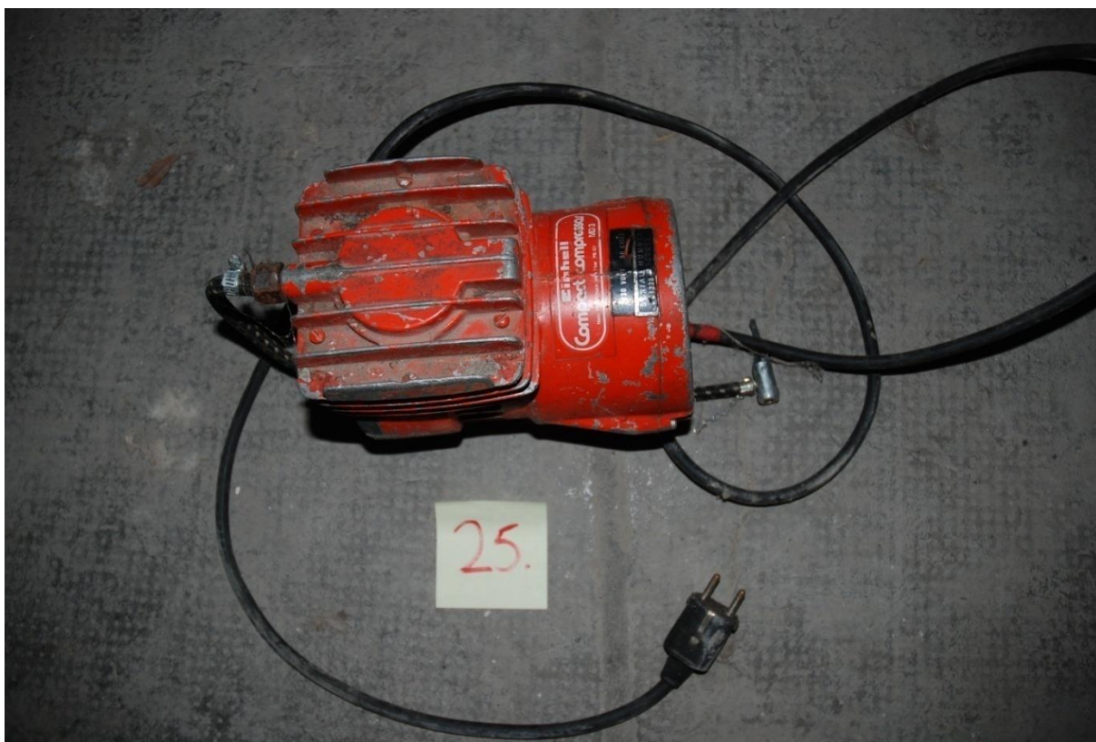
Br.25. Električni kompresor za duvanje guma, oduzete dana 17.10.2014, godine, u grad Bihać.