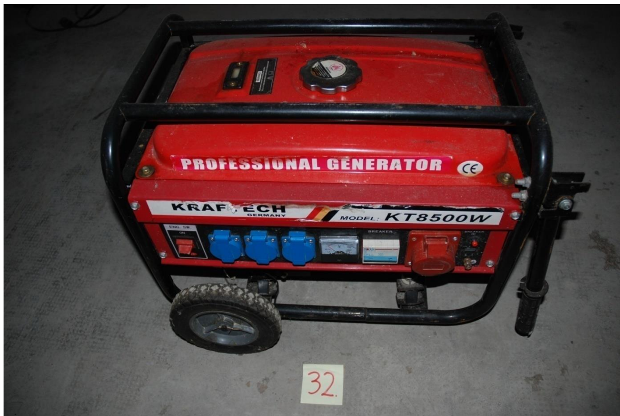
Br.32. Agregat „KRAFTTECH“ KT 8500 W, oduzete dana 17.10.2014, godine, u grad Bihać.