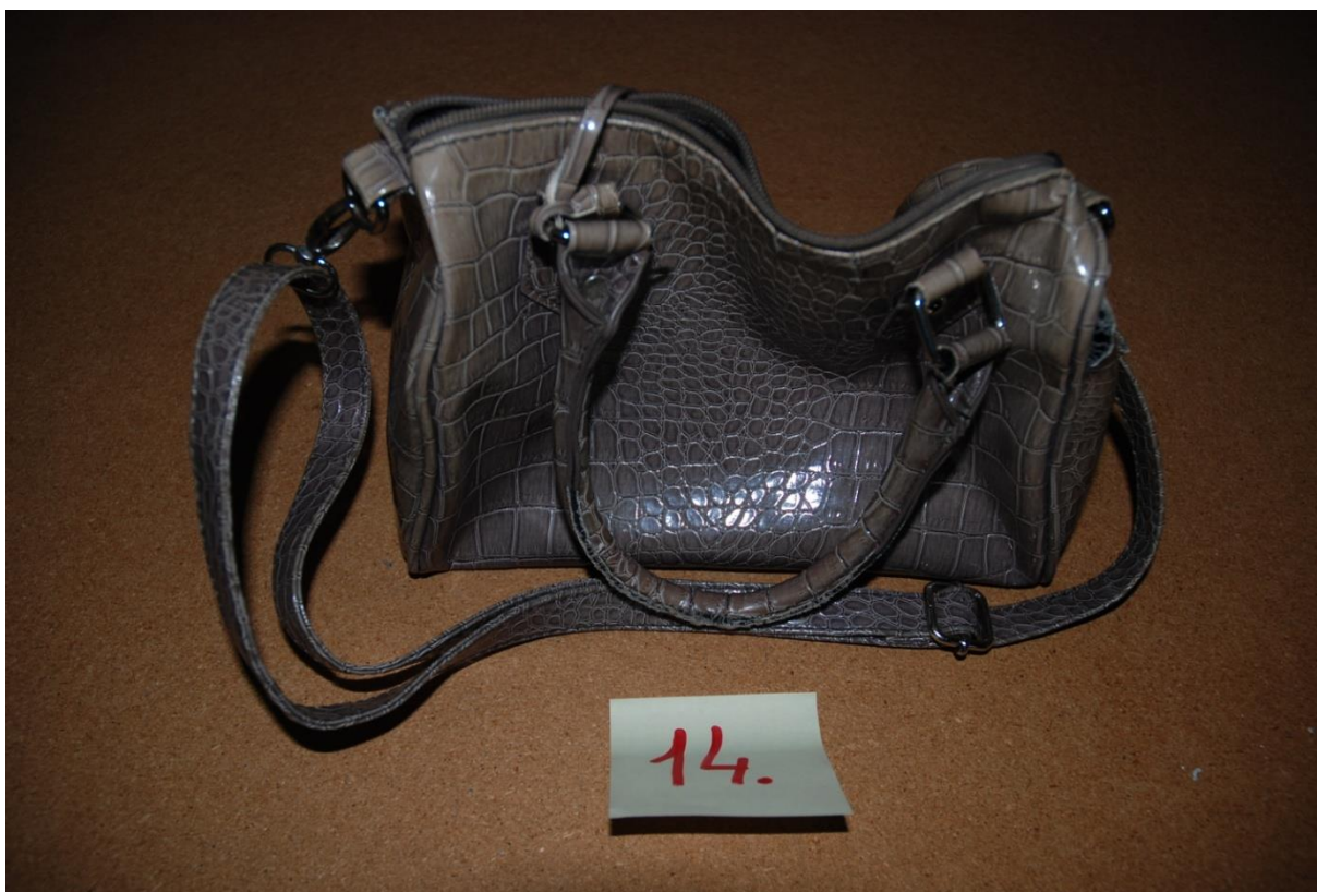
Br.14. Ženska torba, pronađena dana 29.11.2016, godine u ulici Aleja Alije Izetbegovića, grad Bihać.