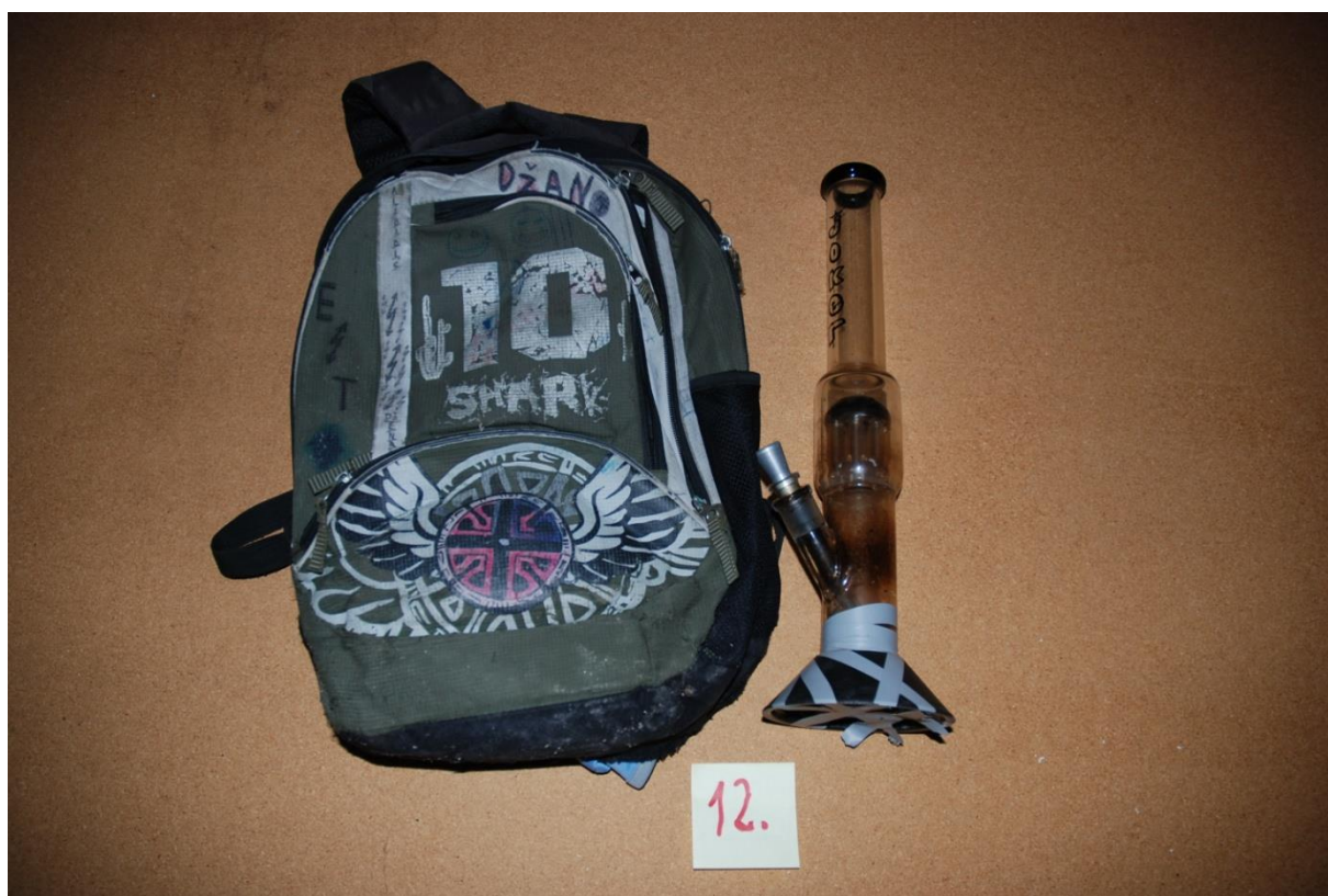
Br.12. Ruksak i staklena nargila, pronađeno dana 22.09.2016, u ulcici krug osnovne škole „Pokoj, grad Bihać.