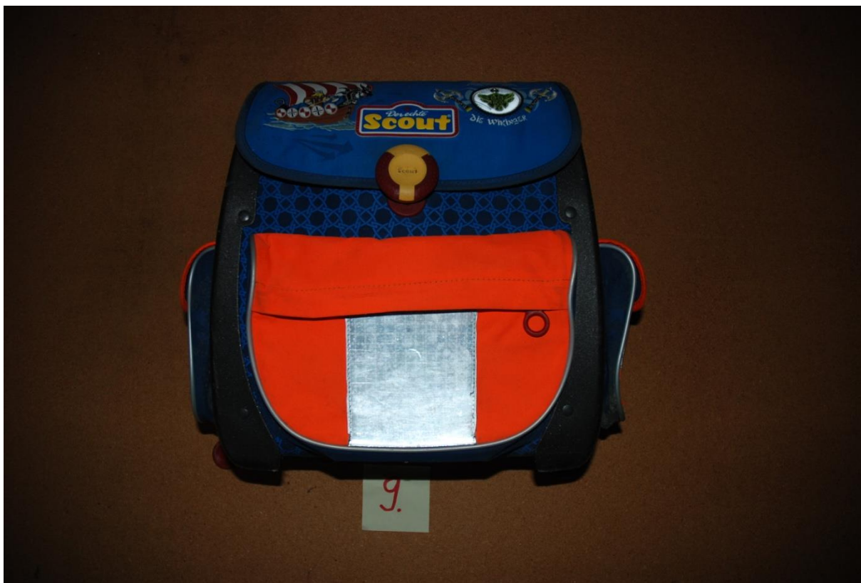
Br.9 Ruksak pronađen dana 16.09.2016, godine u ulici Banjalučka, grad Bihać.