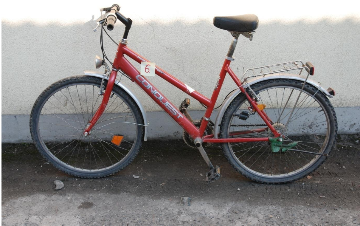
Br.6. Biciklo oduzeto dana 28.11.2016, godine, u grad Bihać.