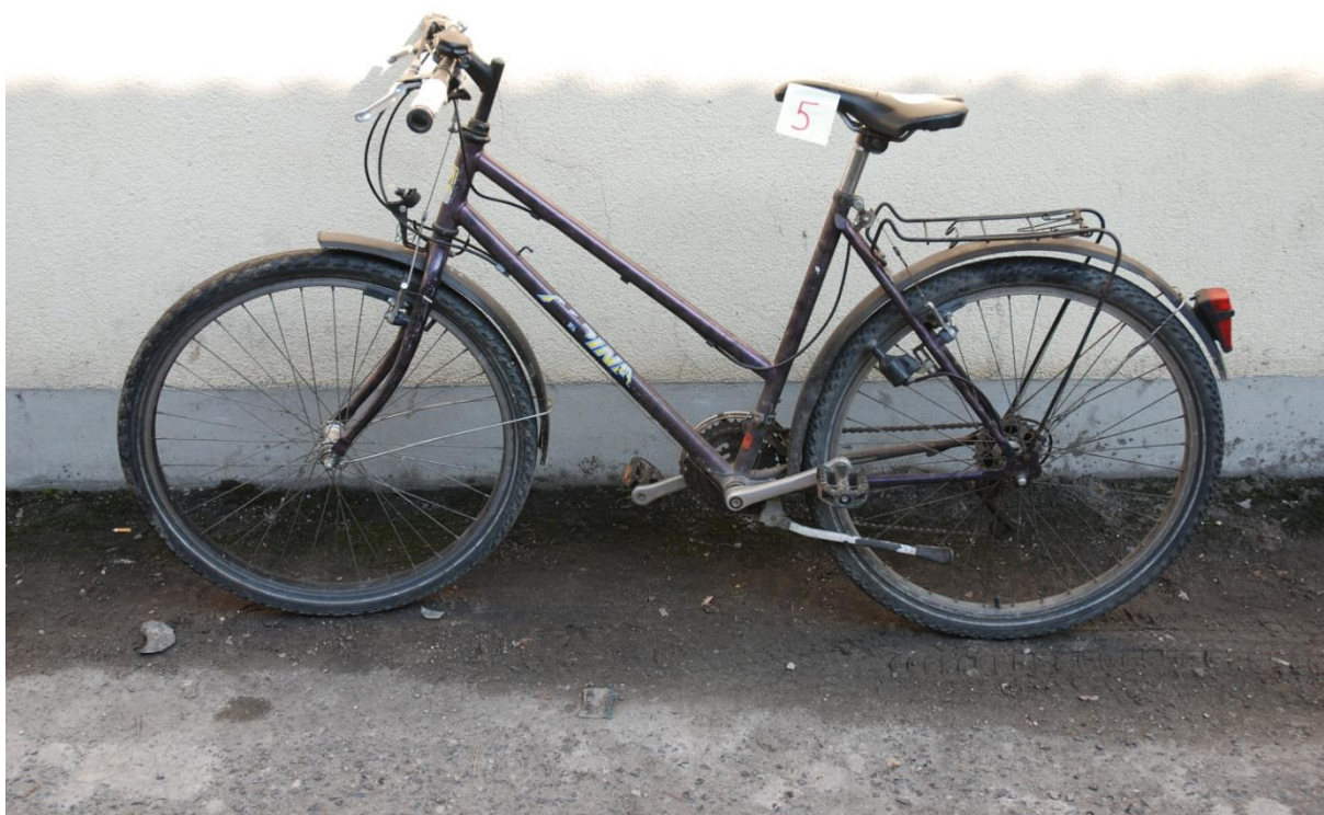
Br.5. Biciklo pronađeno dana 23.11.2016, godine u ulici Sarajevska, grad Bihać.