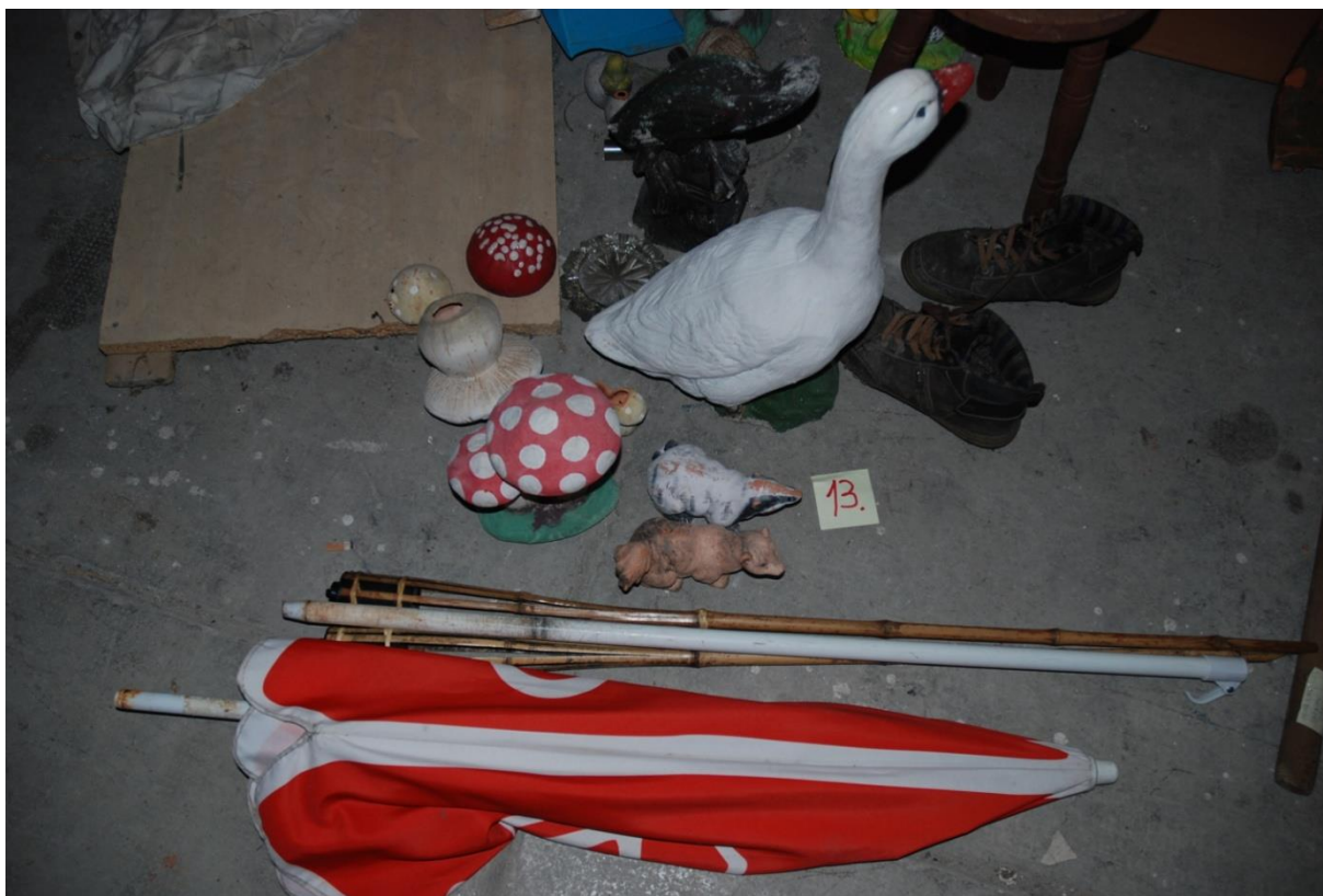
Br.13. Betonske figure, suncobran, baklje, pronađeno dana 17.11.2016, godine u ulici Prijedorska, grad Bihać.