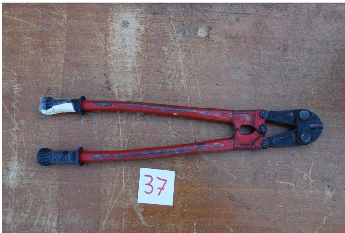
Br.37. Kliješta za željezo, pronađena dana 12.07.2014, godine u ulici Ivana Franje Jukića, grad Bihać.