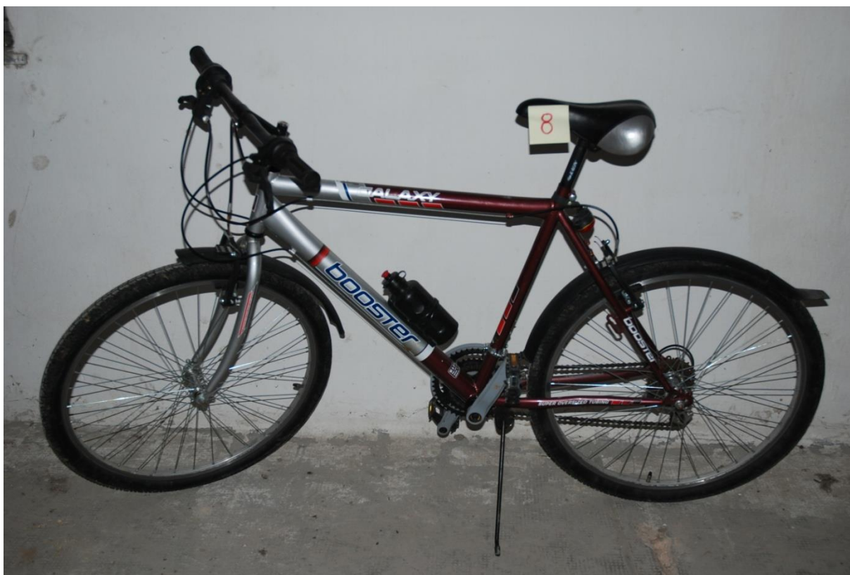
Br.8 Biciklo pronađeno dana 13.09.2016, godine na trotuaru kod hotela „Park“.