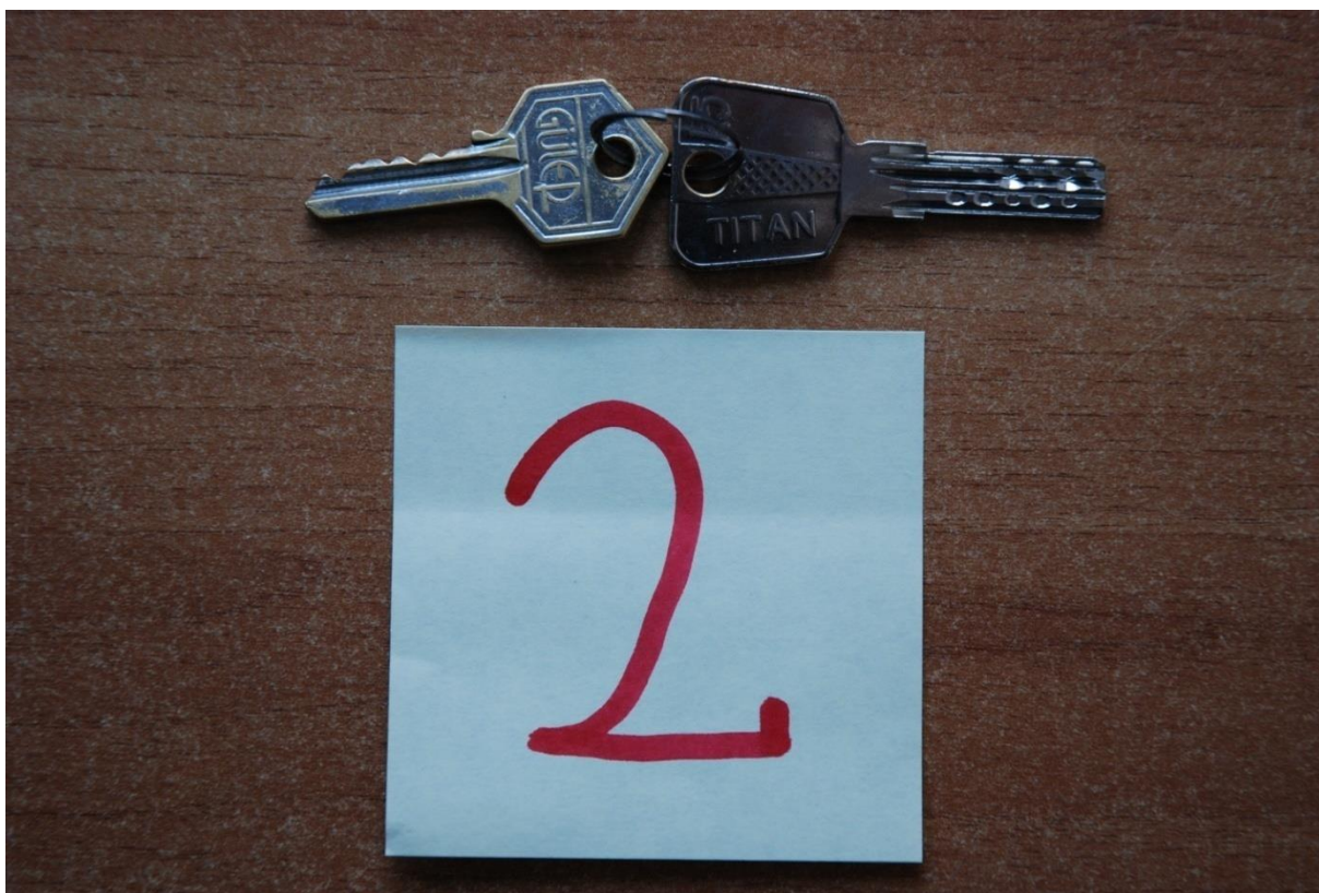
Br.2. Ključevi pronađeni dana 30.08.2016. godine u ulici Gazi Husref Begova, grad Bihać.