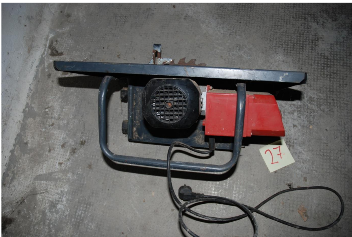
Br.27. Električni cikular „ROTVERK“, oduzete dana 17.10.2014, godine, u grad Bihać.