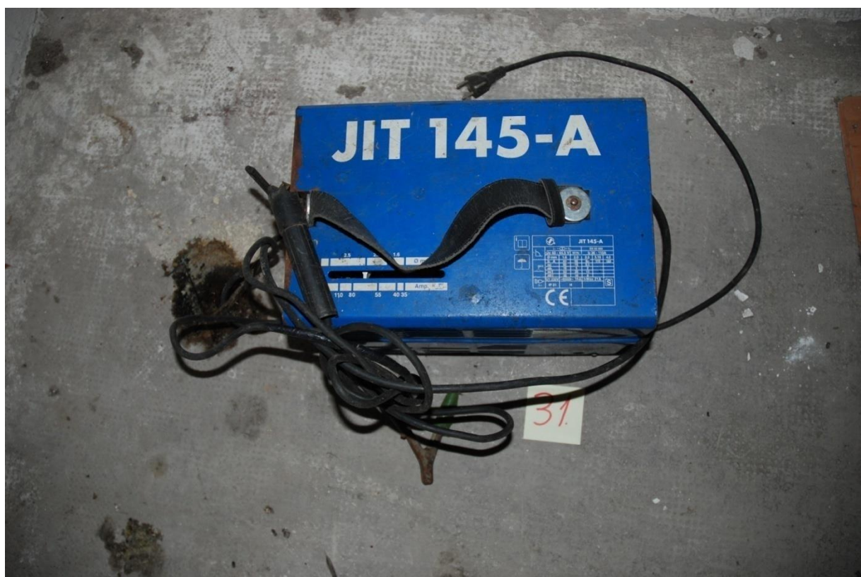
Br.31. Aparat za varenje „JIT 145-A“, oduzete dana 17.10.2014, godine, u grad Bihać.