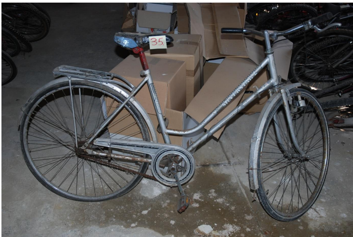
Br.35. Biciklo pronađeno dana 11.01.2014, godine u ulici Ešrefa Kovačevića, grad Bihać.