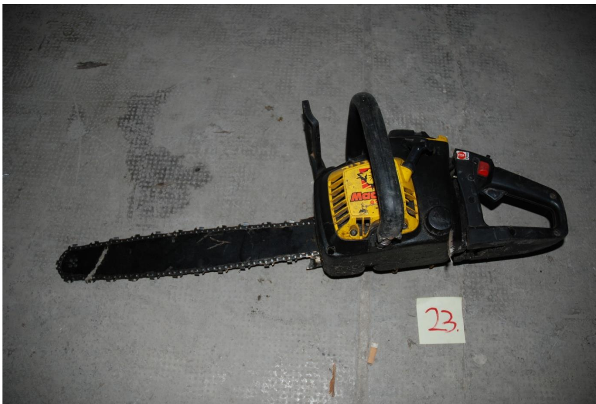
Br.23. Motorna pila „MCCULLOOM 839, oduzete dana 17.10.2014, godine, u grad Bihać.