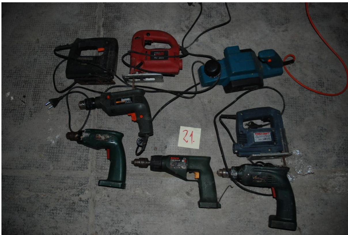
Br.21. Elektro mašine, oduzete dana 17.10.2014, godine, u grad Bihać.