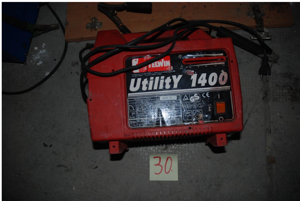
Br.30. Aparat za varenje „UtilitY“, oduzete dana 17.10.2014, godine, u grad Bihać.