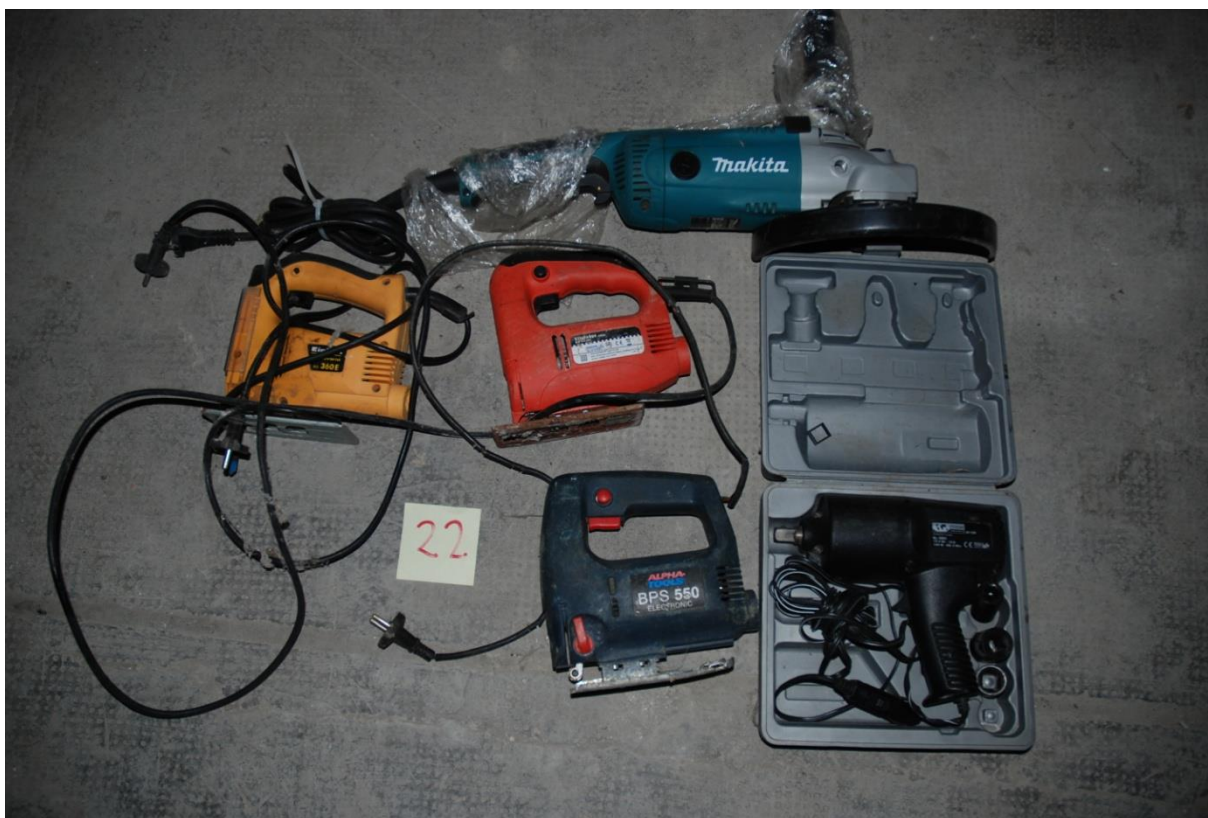
Br.22. Elektro mašine, oduzete dana 17.10.2014, godine, u grad Bihać.