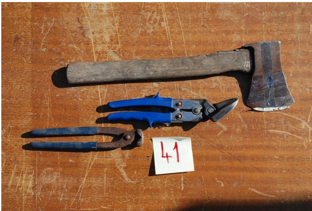
Br.41. Drvene stepenice, kliješta za lim, bigerska kliješta i sjekira, pronađeno dana 11.01.2013, godine u ulici Ivana Franje Jukića, grad Bihać.