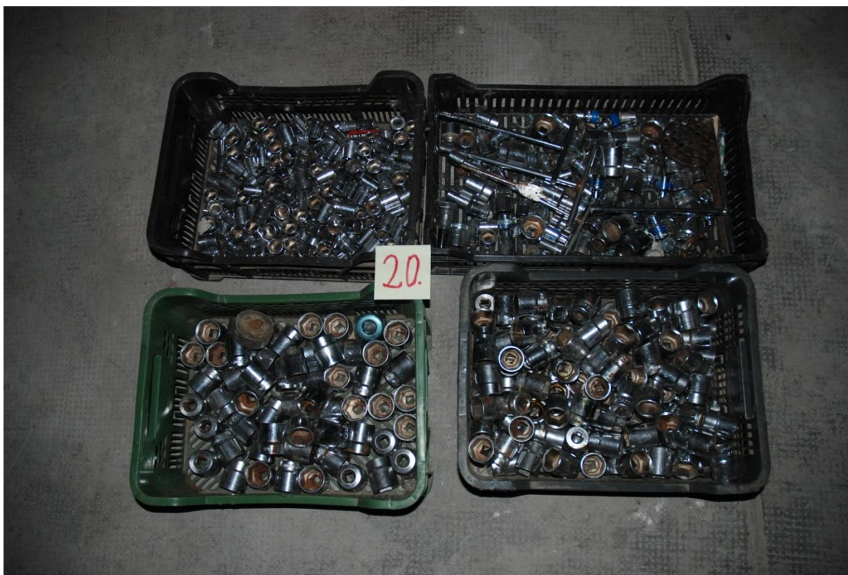
Br.20. Četiri PVC kutije raznih „Gedora“, oduzeto dana 17.10.2014, godine, u grad Bihać.