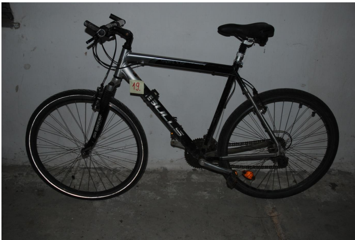
Br.19. Biciklo pronađeno dana 24.04.2015, godine u ulici DR. Irfana Ljubijankića, grad Bihać.