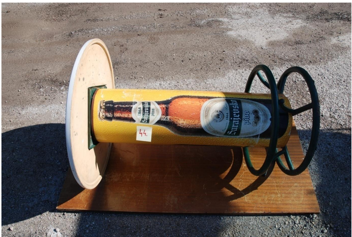
Br.44. Ugostiteljski stol, pronađen dana 12.04.20103, godine u ulici Hamdije Čemerlića, grad Bihać.