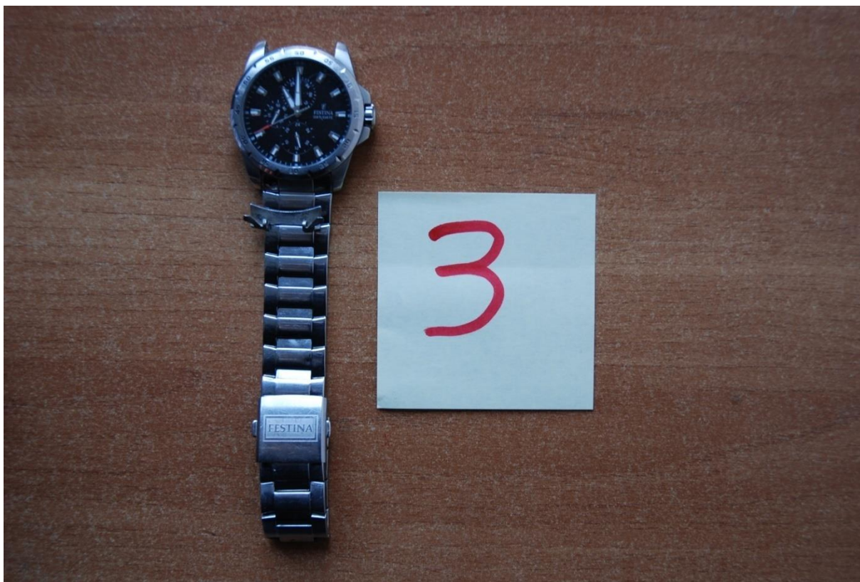
Br.3. Ručni sat „FESTINA“, pronađen dana 30.09.2016, godine u gradskom parku, grad Bihać.