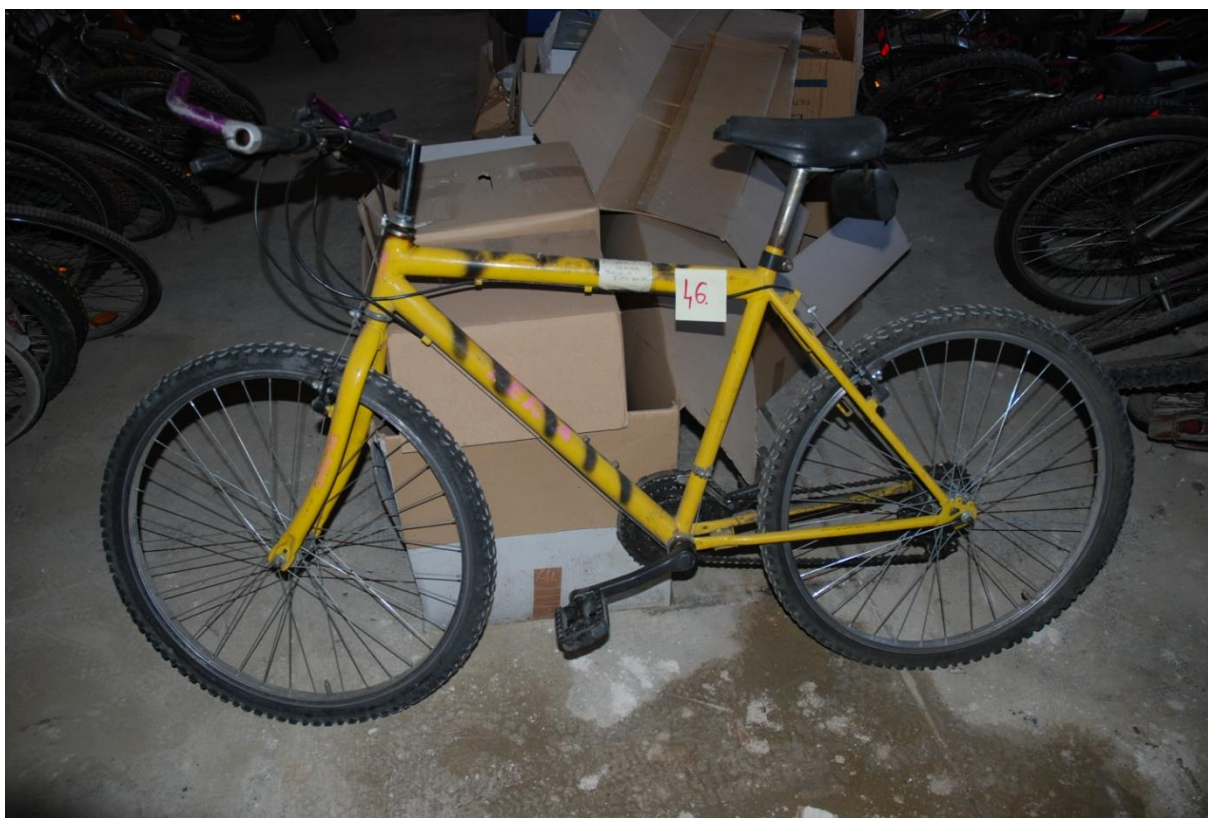
Br.46. Biciklo pronađeno dana 10.06.2013, godine u ulici 501 Slavne brdske brigade, grad Bihać.