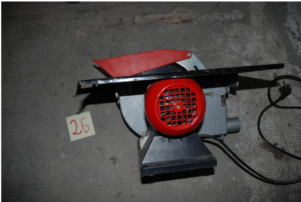
Br.26. Električni cikular „TISCHKREISAGE“, oduzete dana 17.10.2014, godine, u grad Bihać.