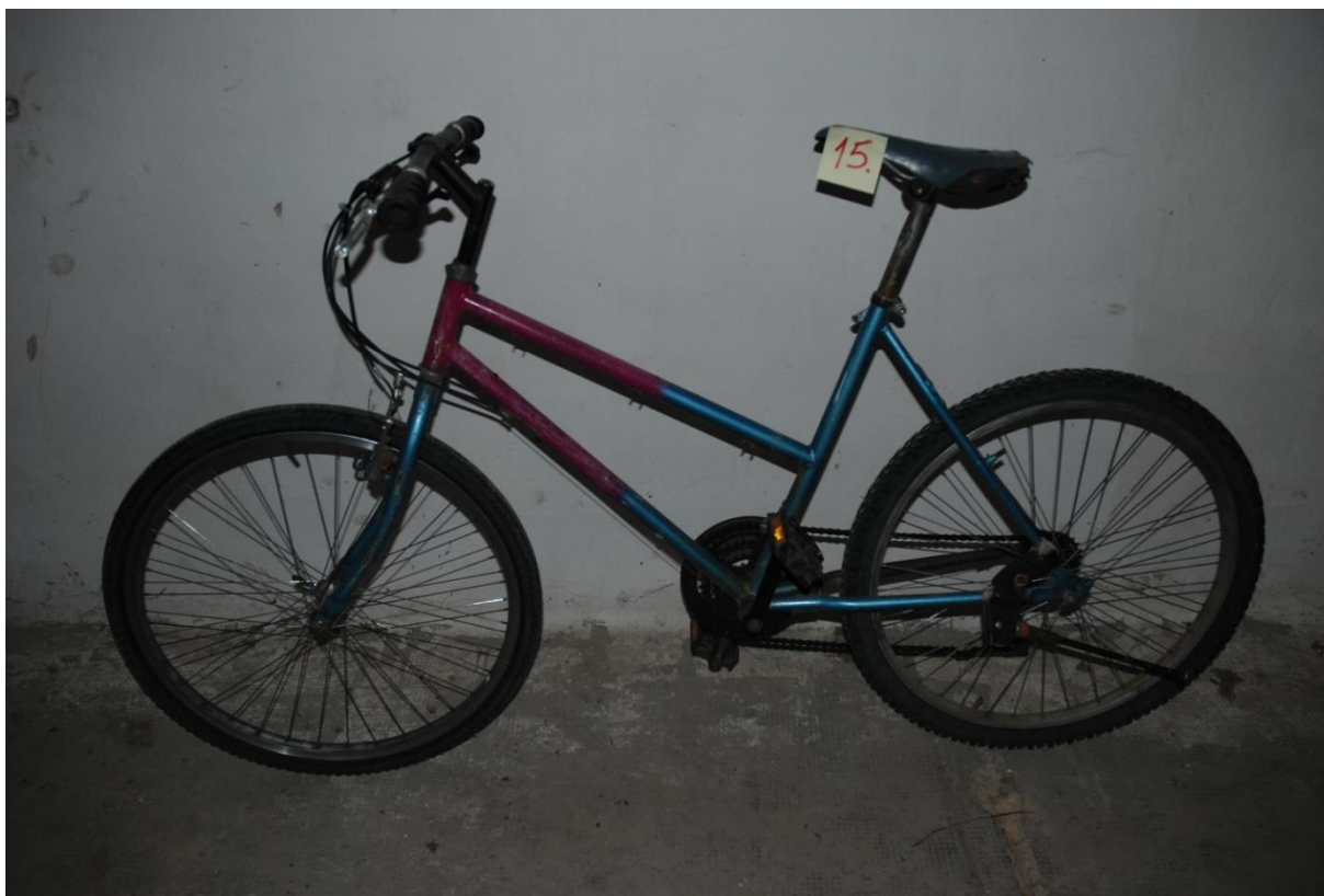
Br.15. Biciklo pronađeno dana 25.08.2016, godine u naselje Kamenica, grad Bihać.