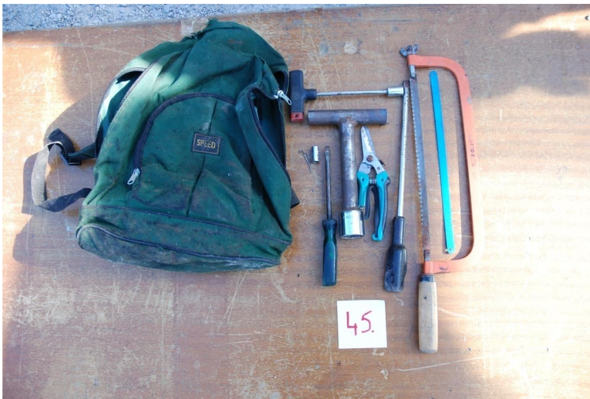
Br.45. Ruksak, pila za metal, šerafciger, gidora ključ, makaze za lim..., pronađeni dana 16.04.2013, godine u krugu firme „Kobiteks“.