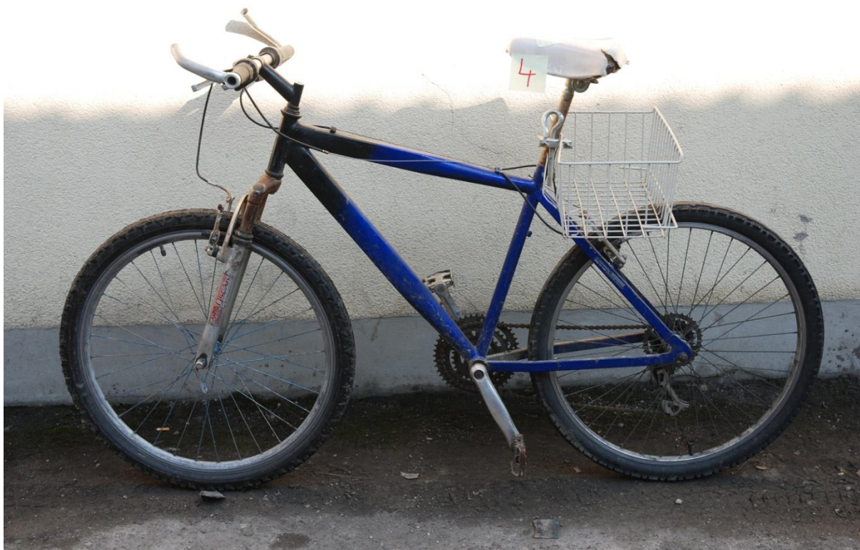
Br.4. Biciklo pronađeno dana 01.11.2016, godine u ulici Ešrefa Kovačevića, grad Bihać.