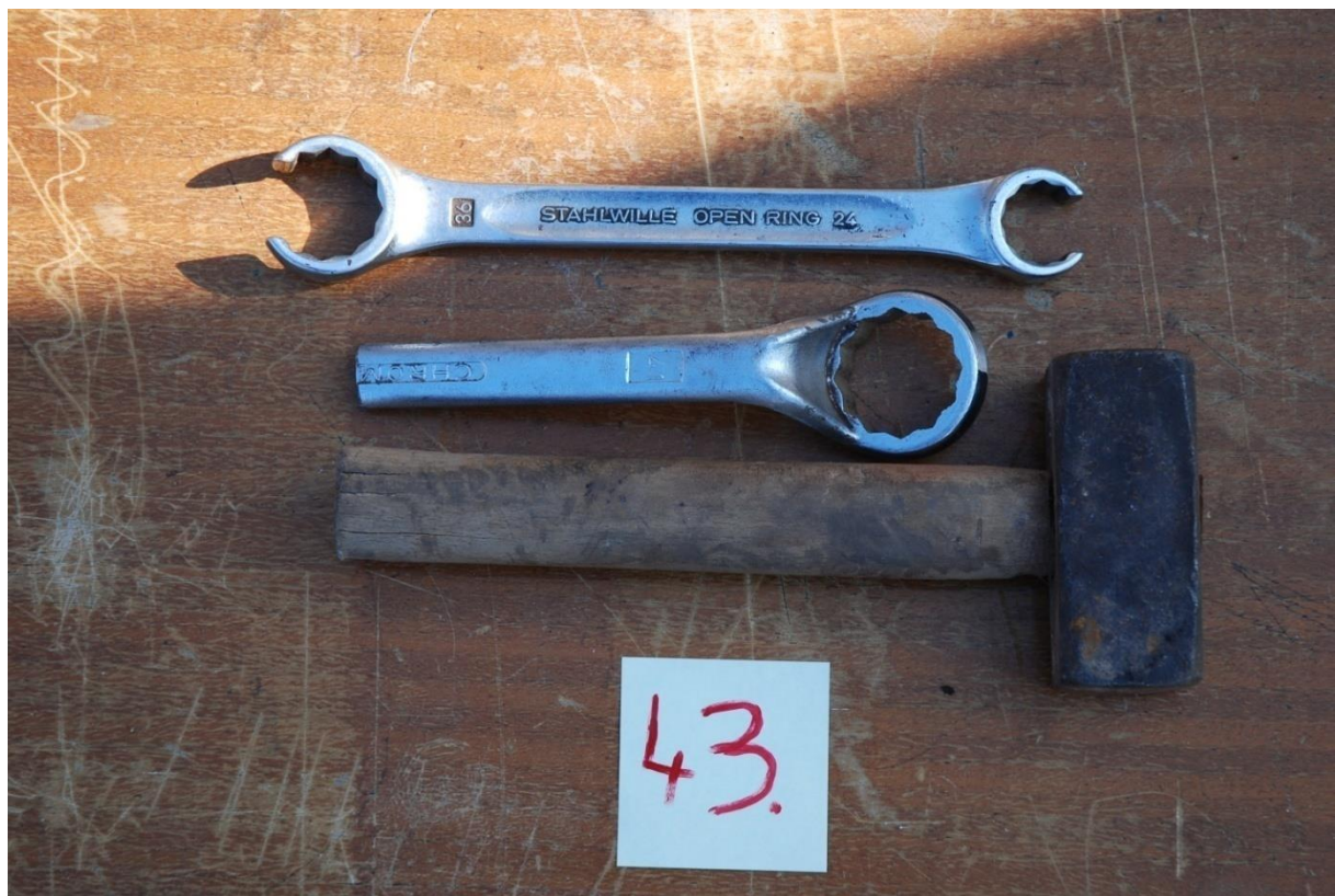
Br.43. Metalni odvijač-dva komada i čekić, pronađeno dana 08.03.2013, godine u naselju Ripač, grad Bihać.