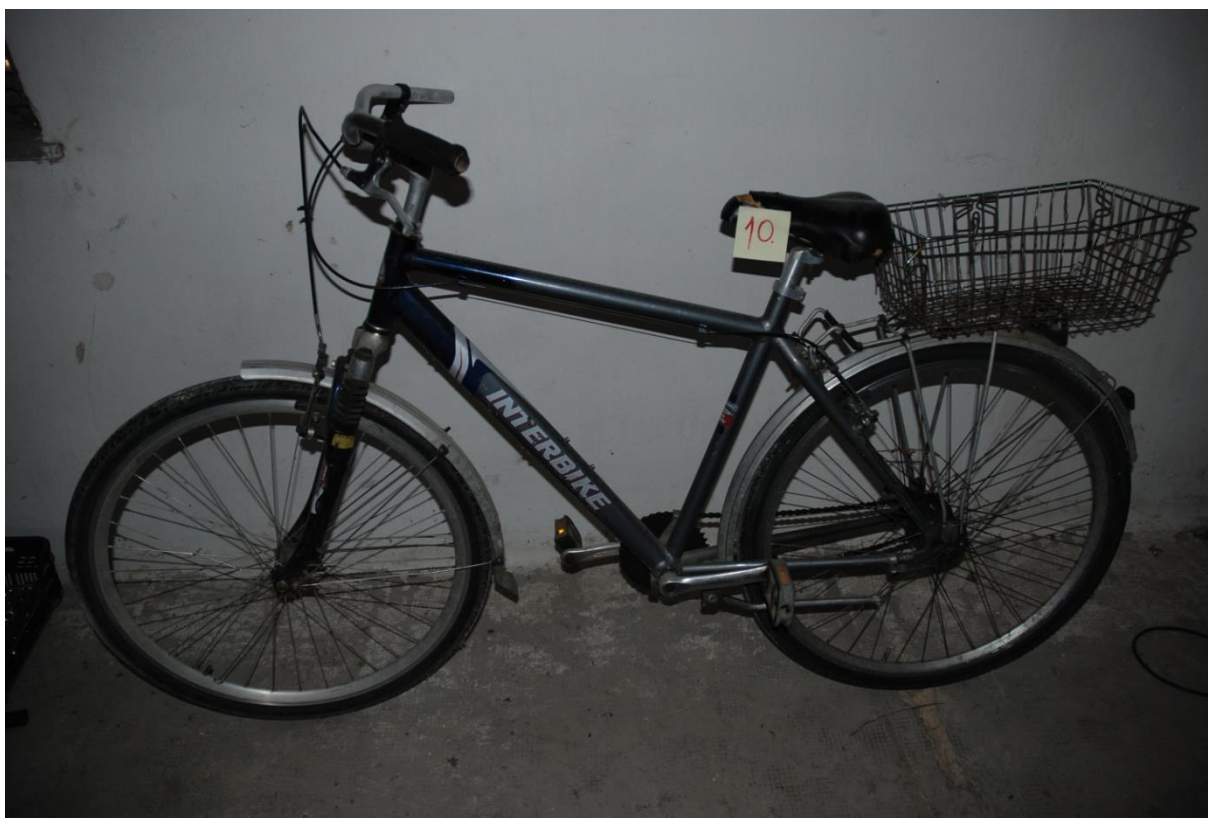
Br.10. Biciklo pronađeno dana 17.09.2016, godine u ulici Hadžiabdića mahala, grad Bihać.