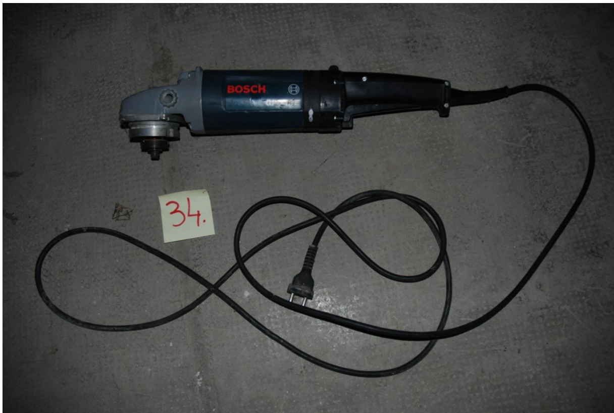
Br.34. Električna flekserica „BOSCH“, oduzete dana 17.10.2014, godine, u grad Bihać.