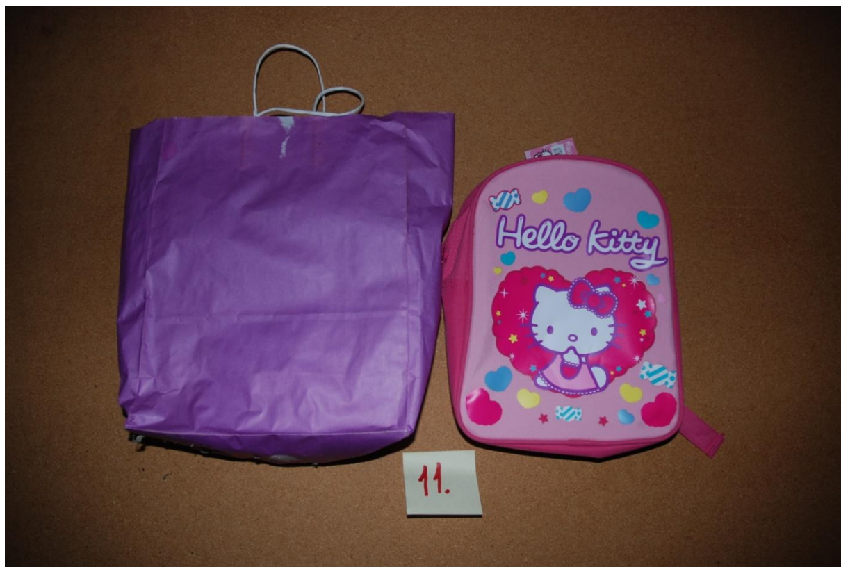
Br.11. Dječiji ruksak pronađen dana 22.08.2016, godine u ulci Bosanska, prostorije PC-Krajina, grad Bihać.