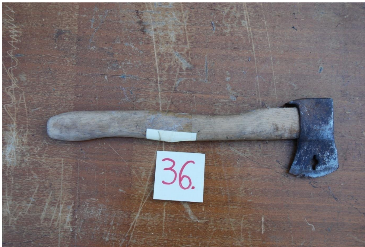
Br.36. Sjekira pronađena dana 22.07.2014, godine u ulici Trg maršala Tita, grad Bihać.