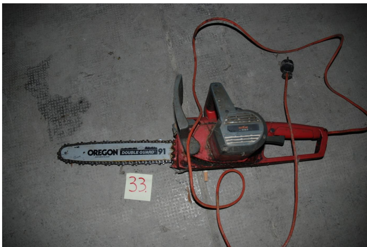
Br.33. Električna motorna pila „HURRICANE“, oduzete dana 17.10.2014, godine, u grad Bihać.