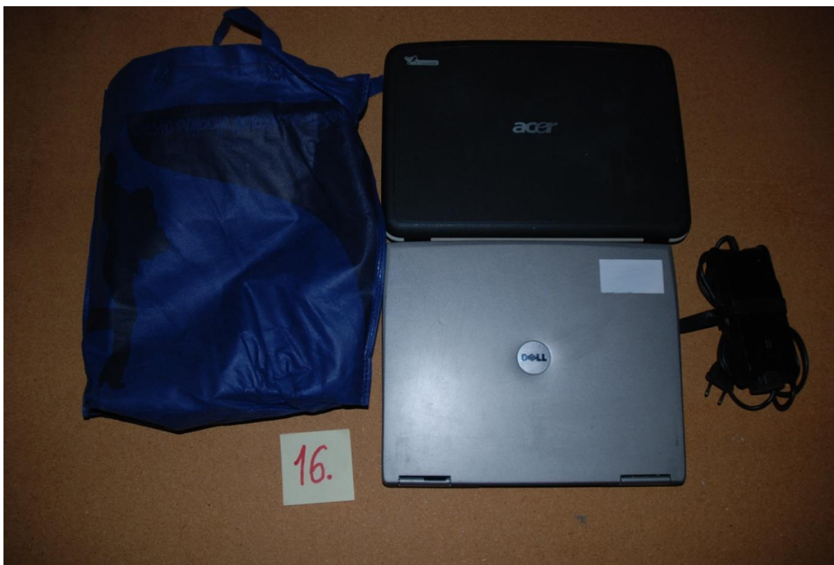
Br.16. Laptop „ACER“ bez punjača i laptop „DEL“, sa punjačem, oduzeto dana 09.04.2016, godine, u grad Bihać.