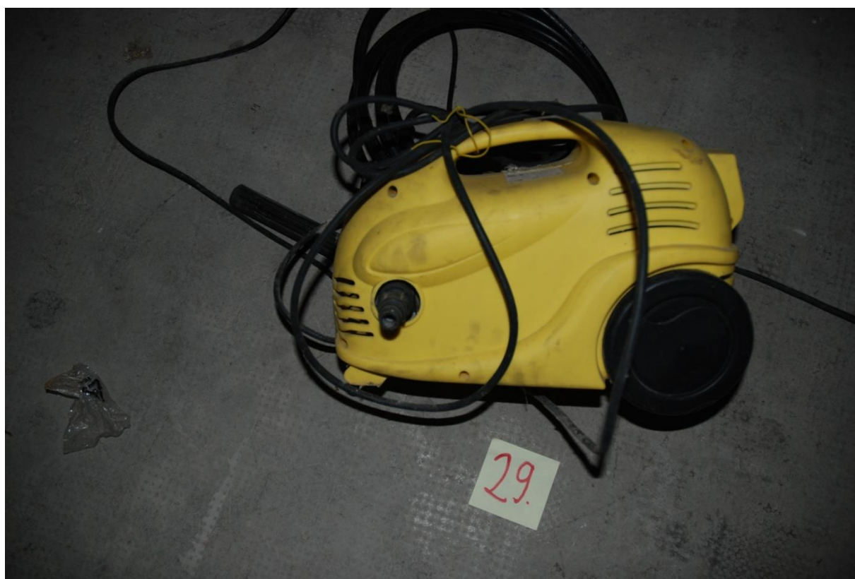
Br.29. Univaš „CRAFTER“, oduzete dana 17.10.2014, godine, u grad Bihać.