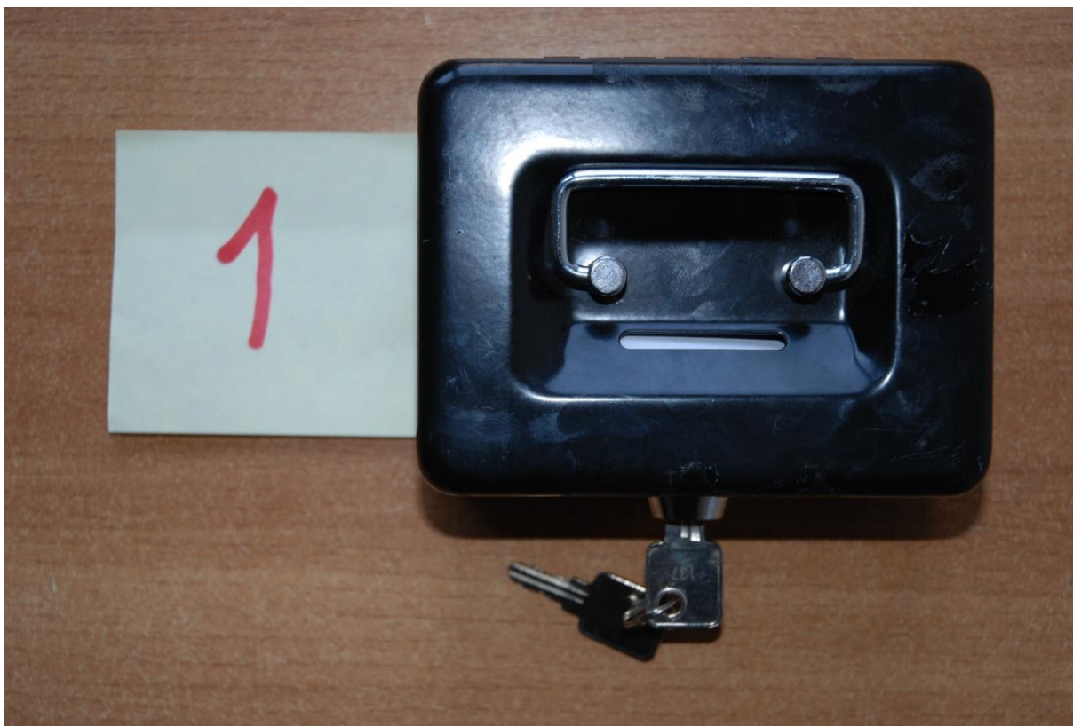
Br.1. Metalna kasa pronađena dana 31.08.2016, godine u ulici Ceravačka brda, grad Bihać.