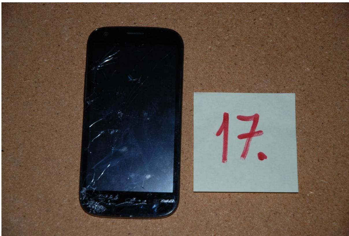
Br.17. Mobilni telefon „ZTE“, pronađen dana 20.06.2015 godine, u ulici Sarajevska, grad Bihać.