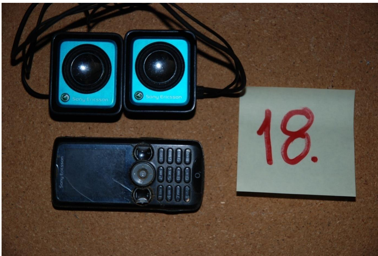
Br.18. Mobilni telefon „Sony Ericsson“ sa dva zvučnika, pronađeno dana 24.07.2015 godine, SRC Stens, grad Bihać.