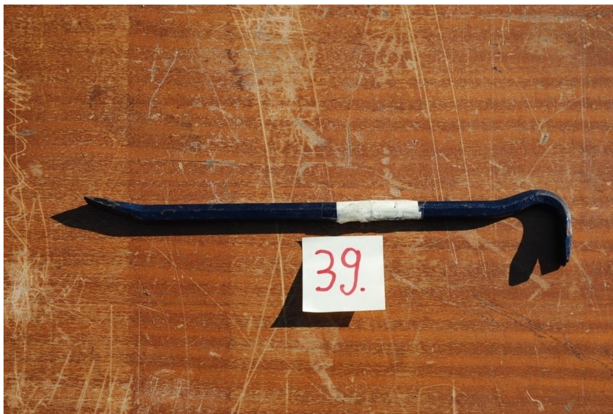
Br.39. Pajser, pronađen dana 14.08.2014, godine u ulici Gazi Husref Begova, grad Bihać.