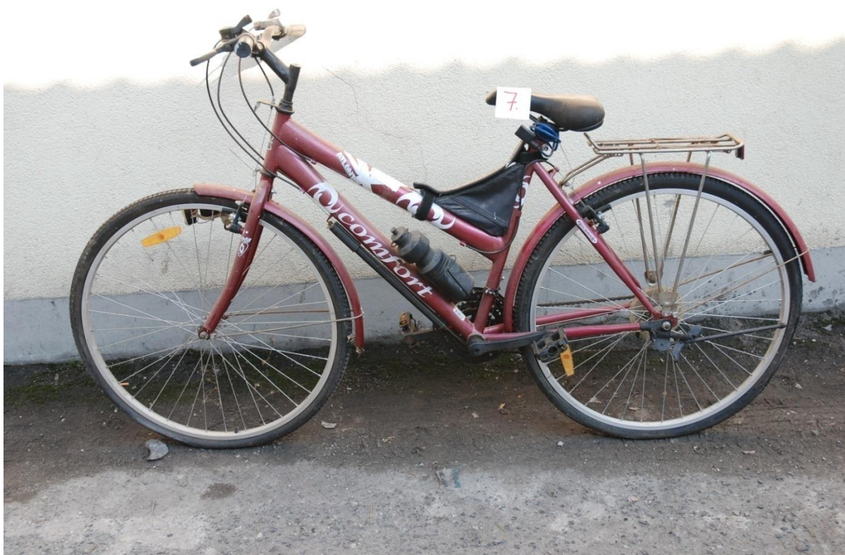
Br.7. Biciklo oduzeto dana 28.11.2016, godine u grad Bihać.