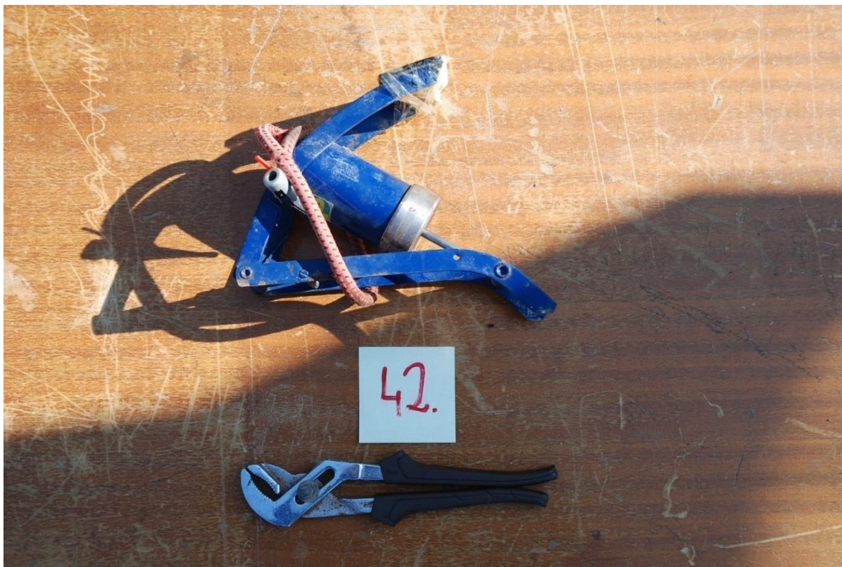
Br.42. Nožna pumpa i kliješta-papagajke, pronađeno dana 17.03.2013, godine u ulici Bosne Srebrene, grad Bihać.