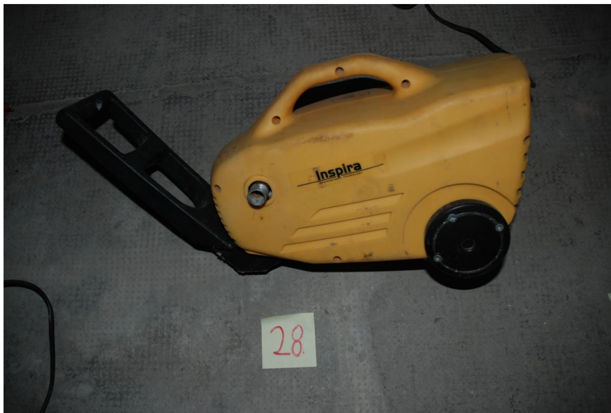
Br.28. Univaš „INSPIRA“, oduzete dana 17.10.2014, godine, u grad Bihać.