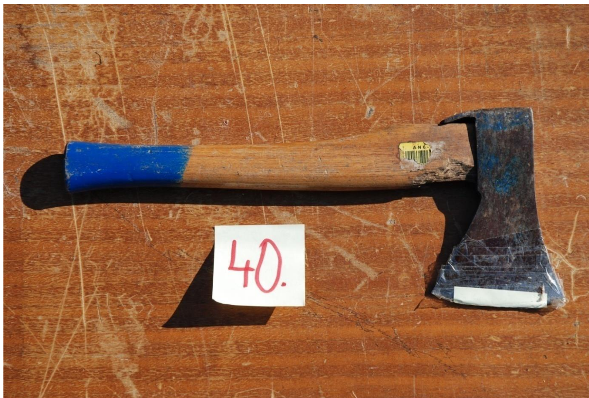
Br.40. Sjekira, pronađena dana 12.11.2014, godine u ulici Safvet bega Bašagića grad Bihać.